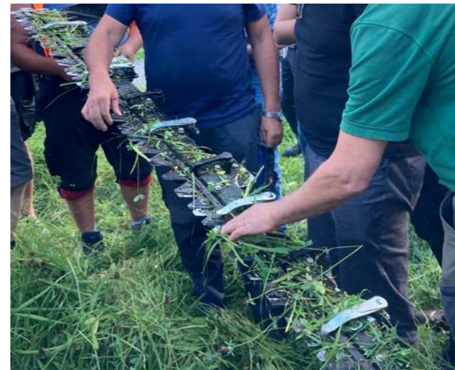
Doppelmesserbalken-Mähwerk aus der Nähe

→ Je höher die Pflanzenvielfalt ist, desto höher ist die Insektenvielfalt auf einer Fläche. Artenreiches Grünland ist ein wichtiger Lebensraum!